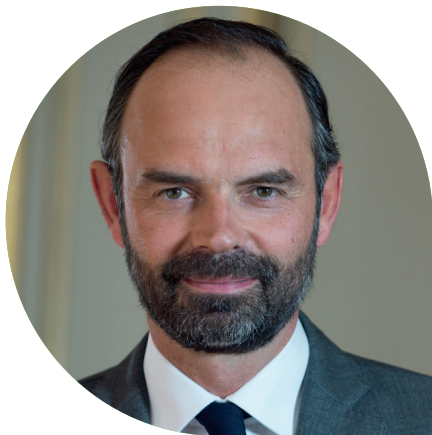
Edouard PHILIPPE Premier ministre